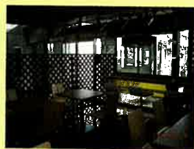
菜の花の黄色を使い、温かみのあるインテリアでまとめられた店内。

営業時間：(原則) 月曜日～金曜日の平日 11:00～15:30 (お食事のみオーダーストップは 15:00) お問い合わせ先：ともしびショップ『なののはな』 電話番号：0463-70-1105