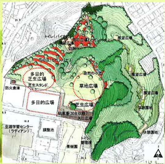
★子育て中以外の方の座談会へのご参加もお待ちしております。

ラディアン裏山一帯の5.5ha※の敷地に、既存の地形や植物をできる限りそのまま生かす形で（仮称）風致公園が建設されます。下から見上げるひな壇には秋の花が植えられ、園内の舗装された道を進むと花の広場、その先は海が見える展望広場へと続き一周約20分の散歩コースとなります。平成27年完成予定で、現在は設計中。来年着工予定です。 ※1ha(3000坪)とは、駐車場を含むラディアンの敷地とほぼ同じ大きさ。